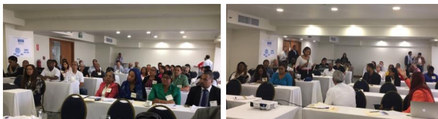
Imagen 2. Taller de nacional de evaluación del proceso de preparación para REDD+.

Como resultado del taller, se obtuvo que de manera general “hay avances, pero falta trabajo por hacer” en el proceso de preparación para REDD+ en el país. En la siguiente tabla se muestra el resumen de los resultados de la evaluación participativa por subcomponente: